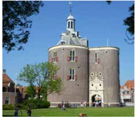
Cinema Enkhuizen in de Drommedaris