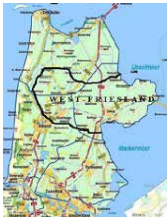
Doelgebied Westfriesland- Oost

Films en documentaires over en van kunstenaars maken onderdeel uit van het maandelijkse programma. We bieden hiermee een podium aan vrije geesten en creatieve denkers.