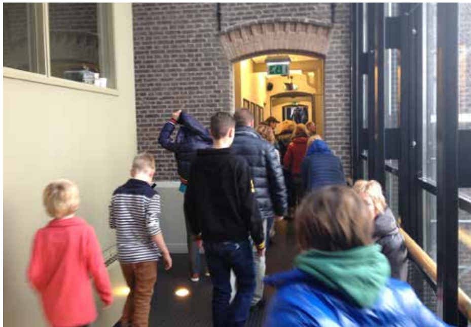
Schoolfilm bij Cinema Oostereiland