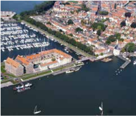
Cinema Oostereiland op het Oostereiland in Hoorn

Met de verhuizing van Filmhuis Hoorn naar het Oostereiland in 2011 is Stichting Cinema Oostereiland opgericht. Sindsdien heeft de Cinema zich ontwikkeld tot een publiekstrekkende ontmoetingsplaats voor film liefhebbers met rond de 50.000 bezoekers per jaar. Cinema Oostereiland organiseert 6-9 voorstellingen per dag en is het gehele jaar geopend.